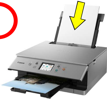
背面から連続給紙できるプリンター