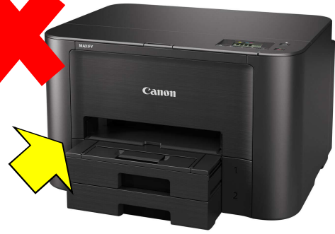
背面から給紙できないプリンター

※ 新しいプリンターをご購入の際には、U S B ケーブルが同梱されているかをご確認ください。