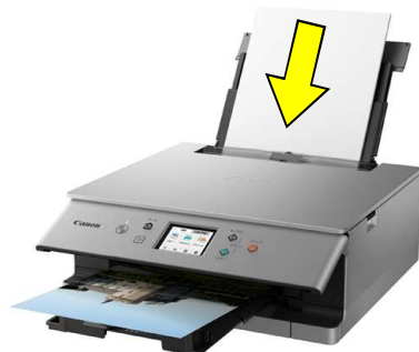
○ 背面から給紙できるプリンター