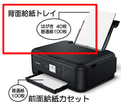
○ 背面のA4給紙枚数が充分ある

□ 連続給紙できるかチェックするには、背面トレイのA4（普通紙）給紙枚数を確認してください。