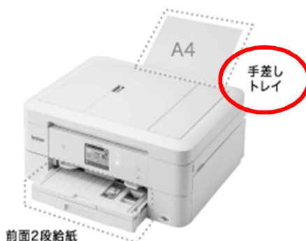
× 背面トレイが「手差し」しかない