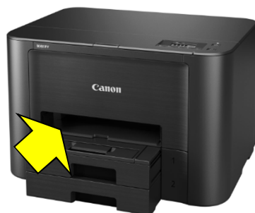
× 背面から給紙できないプリンター

□ 連続給紙できるかチェックするには、背面トレイのA4（普通紙）給紙枚数を確認してください。