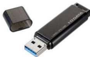
U S B メモリ

パソコンが起動せずレセコンデータが取り出せないなど突然のトラブルからデータを守るためにも必ず外部ストレージをご用意いただき、 こまめにバックアップを取っていただくようお願いします。 外部ストレージのデータ容量は1 G B以上のものをご用意ください。